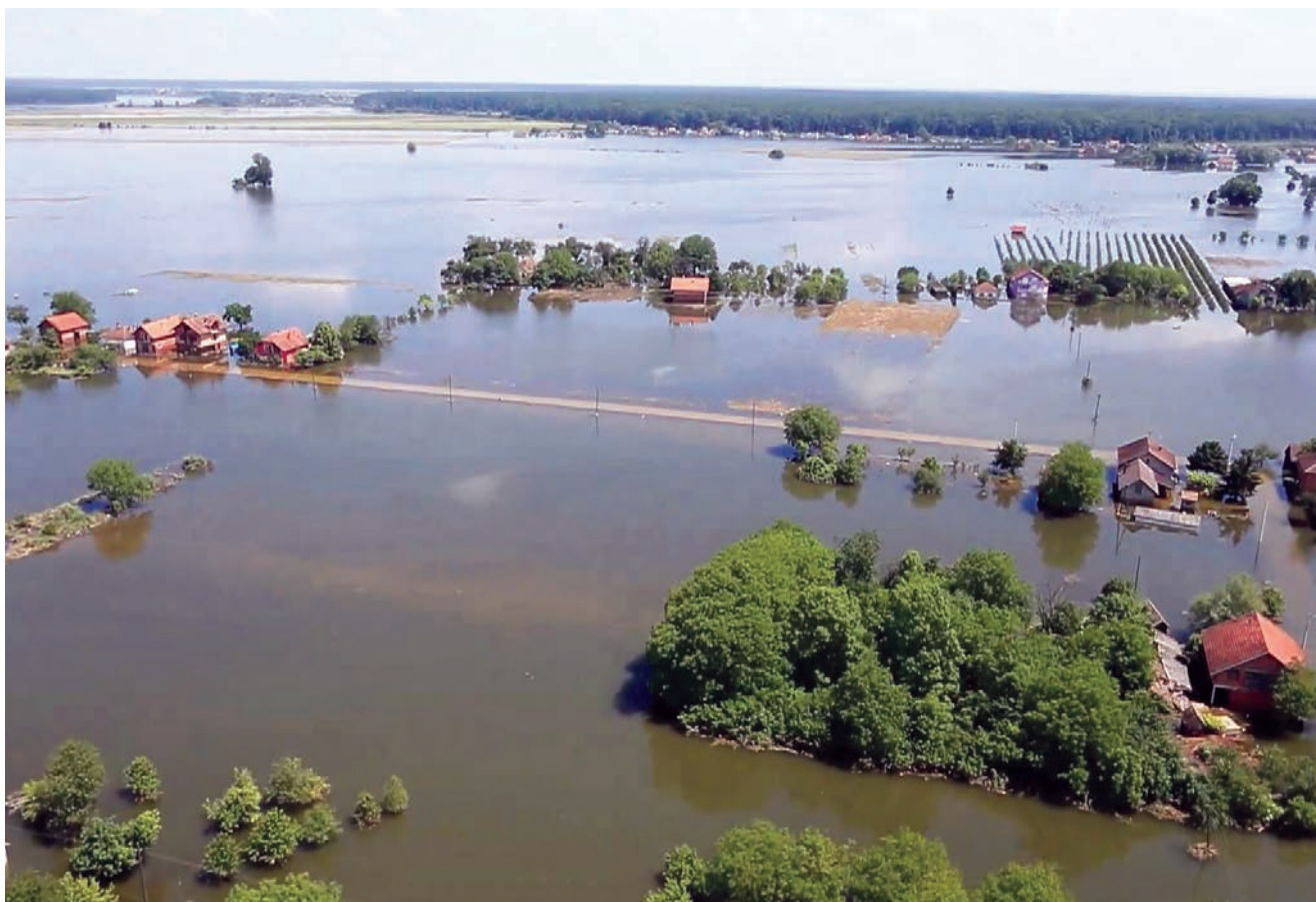
Pogled iz zraka na poplavljenu Gunju 2015. godine

praktički je donesena odluka o raspadu, a registracijom novih poduzeća 23. srpnja 1991. prestao je postojati negdašnji Hidroprojekt . U šali bi se moglo reći da je pet slijednika te tvrtke svoju samostalnost steklo znatno lakše nego pet samostalnih država bivše Jugoslavije. Odluku o razdruživanju nije bilo teško donijeti jer su grupe u Hidroprojektu već otprije posjedovale znatnu autonomnost u poslovanju i odlučivanju, čak i u podjeli ostvarene dobiti.