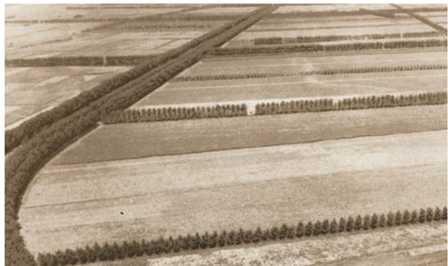
Prikaz navodnjavanja (detalj iz prospekta)