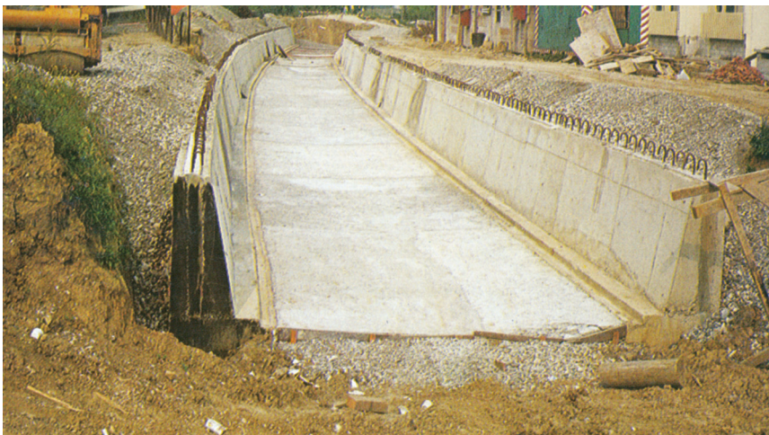
Novo korito jednoga bujičnog potoka (detalj naslovnice prospekta)