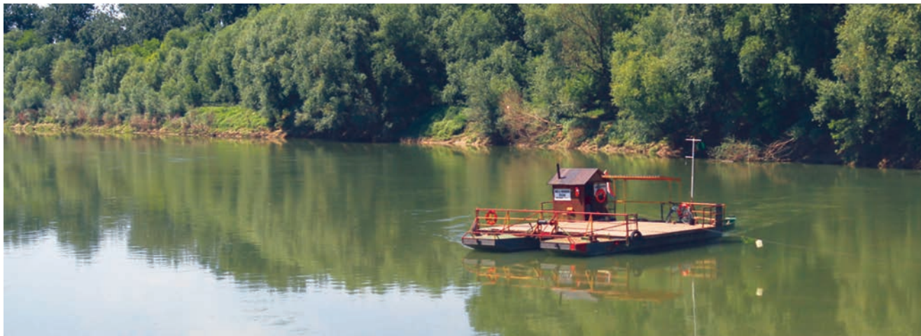
Skela u Rugvici gdje je trebala biti zagrebačka riječna luka

djelovati kao znanstvena ustanova i sve se više okretao stručnom radu.