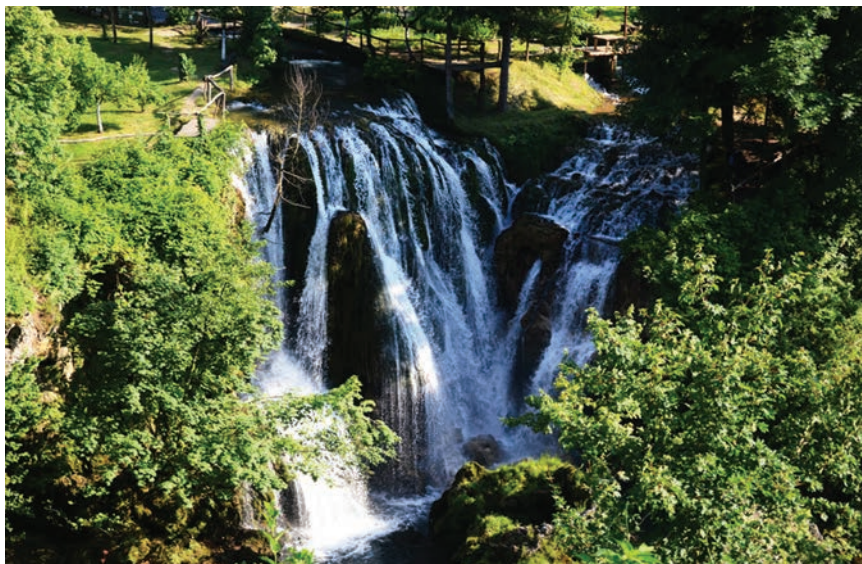
Hrvatska zaista obiluje vodama (detalj s Rastoka)

Još je ostalo otvoreno pitanje kada je, ali i kako i zašto, Hidroprojekt dobio ime koje se s vremenom postalo pravi brend, kako bi danas rekli? To je također vrlo teško ustanoviti, jer su neki slični i u to vrijeme utemeljeni zavodi do danas sačuvali svoje nazive, makar u kraticama poput IPZ-a . Naziv je Hidroprojekt možda dodan odmah na početku, uostalom često se tako i pisalo ( Hidroprojekt – Zemaljski zavod za melioracije i regulacije). To je vjerojatno bilo uzrokovano i činjenicom da se Zavod nije bavio samo po-