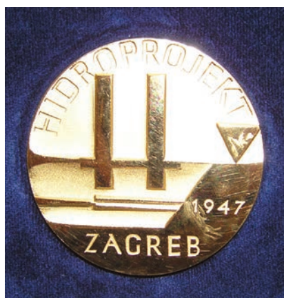
Priznanje koje se dijelilo uz 35. obljetnicu Hidroprojekta

(Desprimska 8). Hidroprojekt-eko d.o.o. se uglavnom bavio projektiranjem uređaja za pročišćavanje i preselio se nekako u istodobno na drugu adresu, a