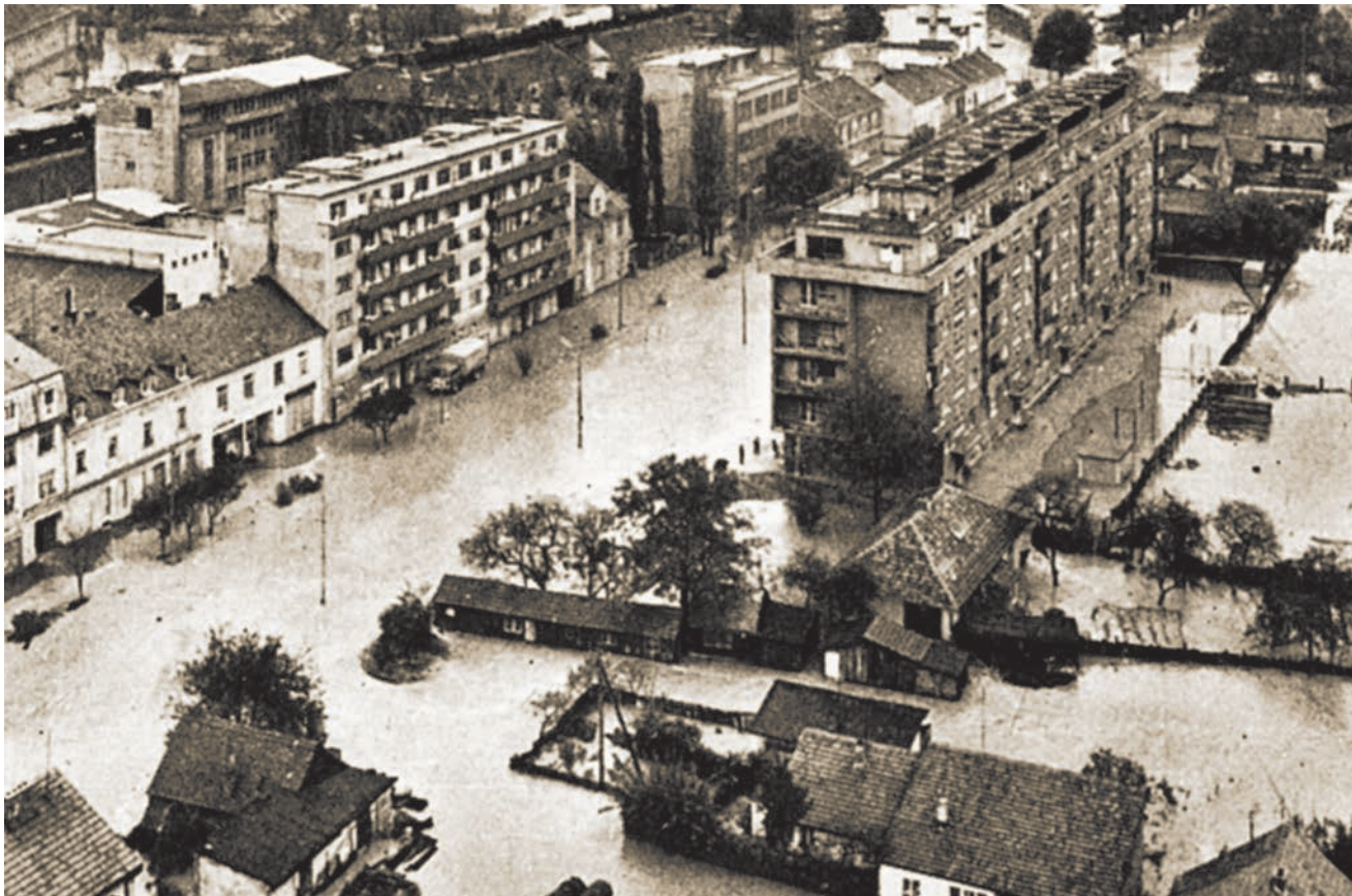
Savska cesta u Zagrebu tijekom poplave 1964. godine