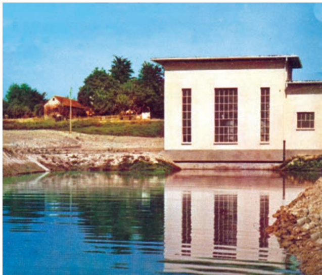
Crpna stanica za odvodnjavanje (detalj iz prospekta)