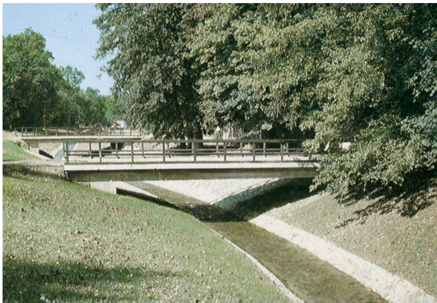
Regulirani potok Bliznec u Zagrebu (iz prospekta)