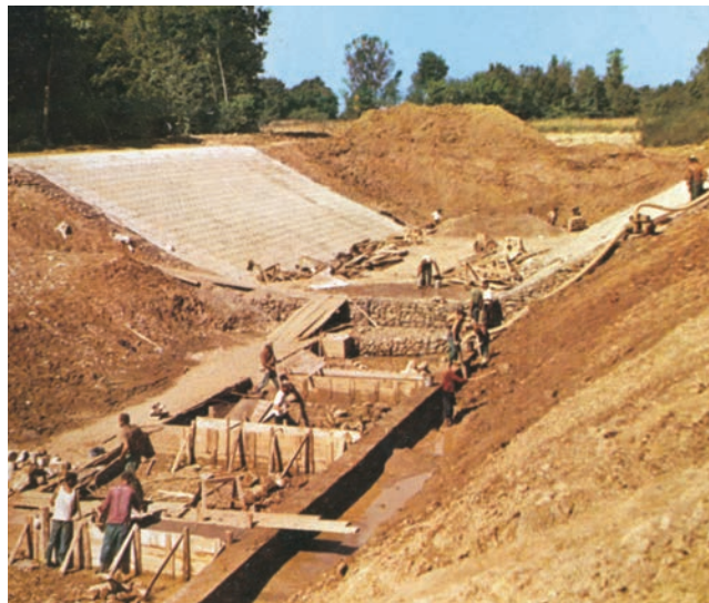
Uređenje korita jednog vodotoka (detalj iz prospekta)

mentacije, savjeti investitorima te kopiranje i fotokopiranje nacрта.