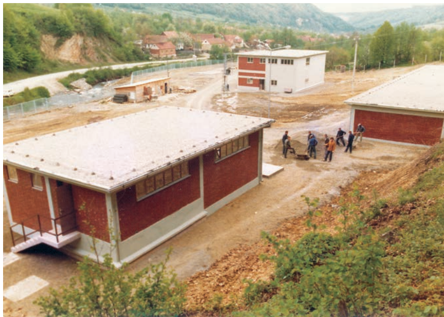
Detalj gradnje crpilišta Šumetlica kraj Pakraca 1977. godine