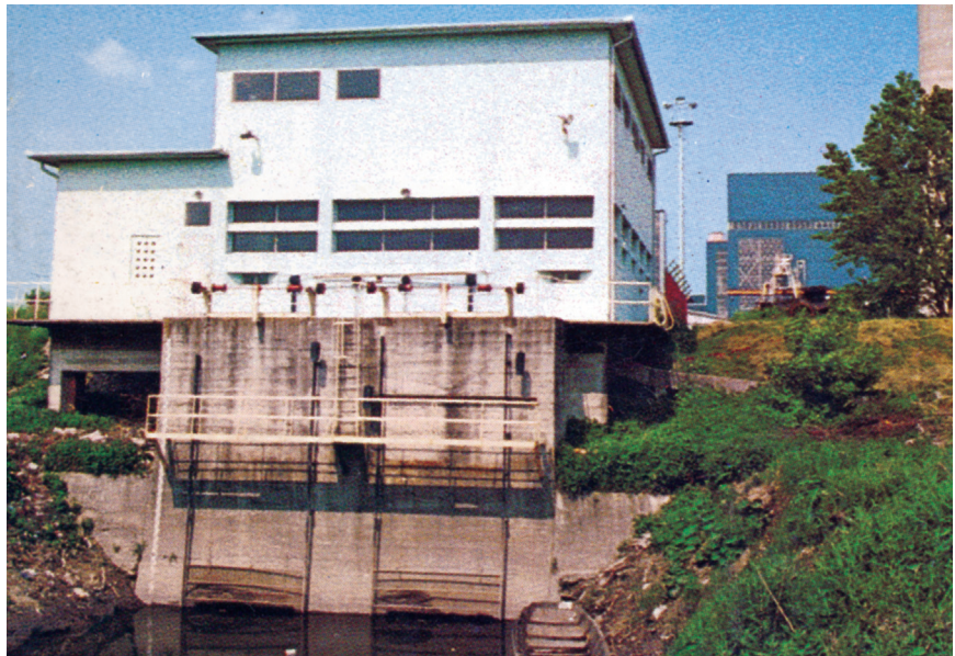
TE-TO Zagreb, zdenac na lijevoj obali (detalj naslovnice prospekta)

Hidroprojekt je projektirao i gradske prometnice i prometna rješenja te industrijske prometnice, obilaznice i šumske ceste, a neko vrijeme i gradsko zelenilo