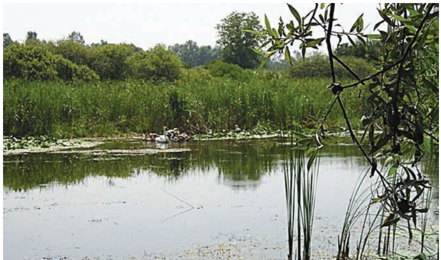
Voda je uvijek bila glavna odrednica Hidroprojekta (detalj iz Lonjskog polja)