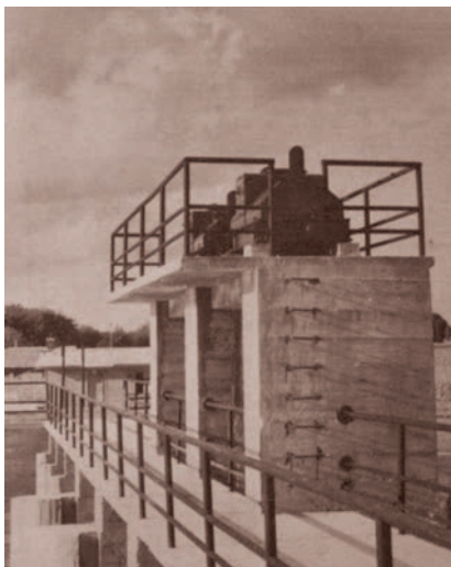
Detalj jedne vodne građevine (iz prospekta)

Ugled je rastao i u stručnoj javnosti i to je projektantsko hidrotehničko poduzeće svrstavano među najbolja i najuglednija u Hrvatskoj. Radilo se puno na raznim stranama, ali se i dobro zarađivalo, a u poduzeće su kroz studentsku praksu dolazili najbolji studenti Hidrotehničkog odjela pri Građevinskom fakultetu u Zagrebu. U početku je to bilo povremeno i sporadično, ali je to s vremenom postala stalna praksa.