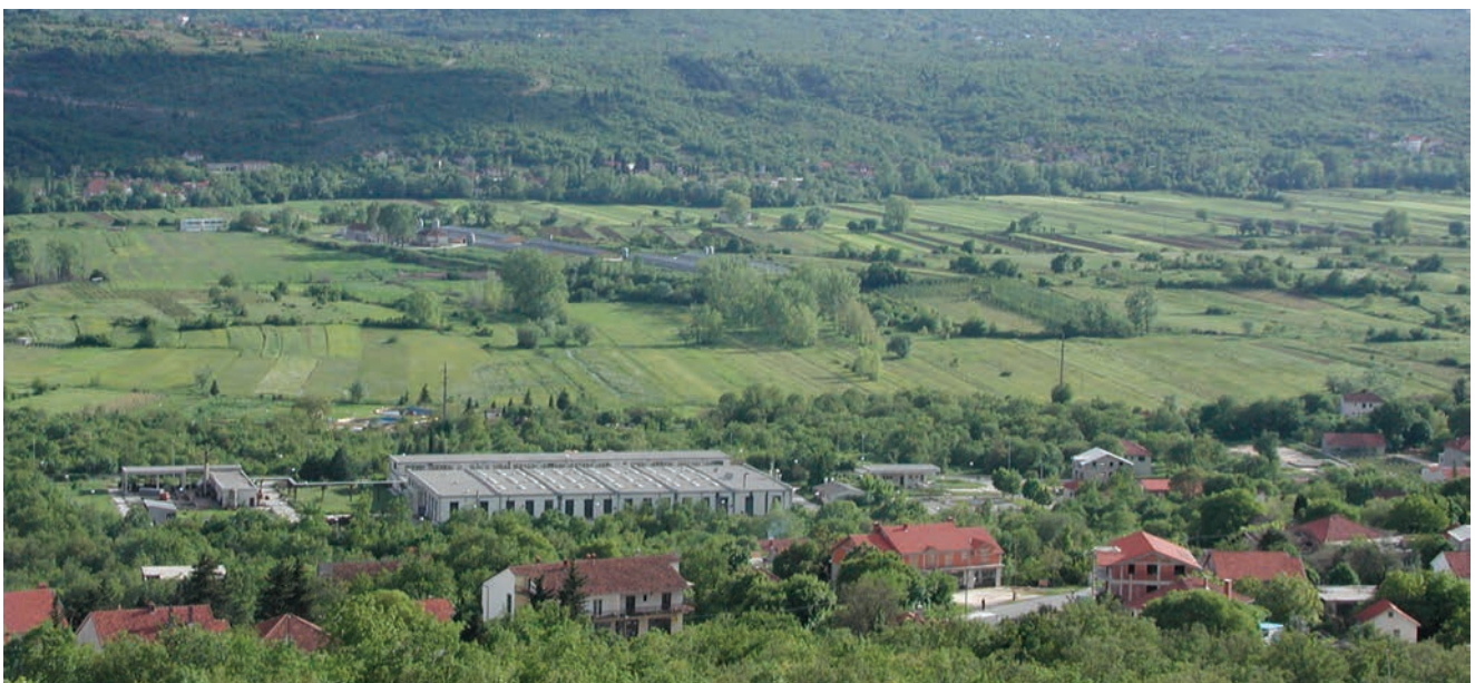
Hidroprojekt je bio uključen i u melioraciju Imotsko-bekijskog polja